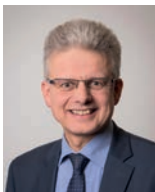
Gerhard Trüün Laar